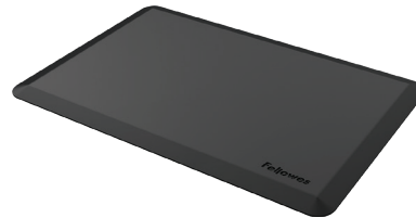
TAPIS ANTI-FATIGUE Bien-être 8707002 - BLACK