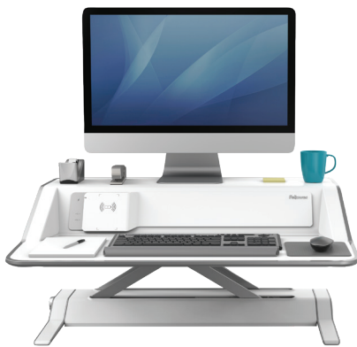
LOTUS TM DX Poste de travail assis-debout

Rester assis pendant des heures peut sembler productif, mais une activité physique limitée pendant la journée de travail peut drainer votre énergie, votre moral et vos performances. Faites une petite promenade ou faites des étirements. Vous pouvez également utiliser un bureau assis-debout dans votre bureau à domicile pour vous rester actif.