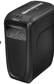
POWERSHRED MD 60Cs Déchiqueteuse à coupe-croisée 4606004