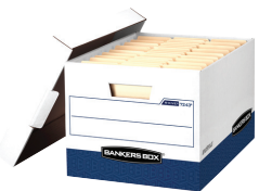
R-KIVE ® BOÎTE DE RANGEMENT USAGE INTENSIF Format lettre/légal 07243

Un bureau à domicile désorganisé peut avoir un impact sur votre productivité. Prenez le temps d'organiser les documents que vous utilisez chaque jour. Bankers Box MD vous offre la possibilité de trier et d'empiler vos fichiers afin de libérer un espace de travail précieux. Robuste et pratique, il permet de transporter des dossiers du bureau à la maison.