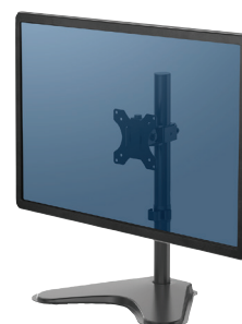
PROFESSIONAL SERIES Support auto-portant articulé 8049601 – Simple