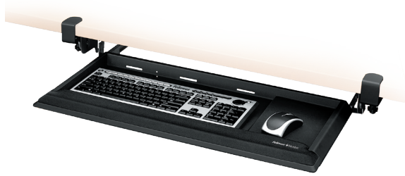
DESIGNER SUITES MC Tiroir de clavier DeskReady MC 8038302

Lorsque vous êtes plus à l'aise, vous êtes plus productif, surtout lorsqu'il s'agit d'utiliser un clavier et une souris. Sélectionnez un plateau de clavier réglable qui positionne avec précision votre clavier et choisissez un support de poignet pour aider à prévenir la tension du poignet.