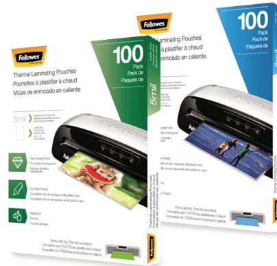
POCHETTES DE PLASTIFICATION THERMIQUE - Pochettes - Lettre 5743301 - Lettre, 3 mils, paquet de 100 5743501 - Lettre, 5 mils, paquet de 100