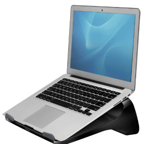
I-SPIRE SERIES MC Support pour ordinateur portable 9472403 – Noir et gris 9311203 – Blanc et gris

La position de votre moniteur est importante. Aidez à prévenir la fatigue du cou et des yeux en personnalisant la hauteur et le placement de votre moniteur sur votre bureau