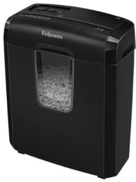
POWERSHRED MD 6C Déchiqueteuse à coupe-croisée 4771502

Les risques de vol d'identité demeurent même lorsque vous travaillez à distance. Si vous gérez des documents confidentiels depuis votre bureau à domicile, veillez à respecter la politique de destruction de documents de votre entreprise. Les déchiqueteuses de papier à coupe-croisée et à micro-coupe offrent les plus hauts niveaux de sécurité. Choisissez un modèle qui convient à votre bureau à domicile.