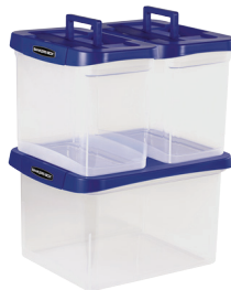
USAGE INTENSIF Boîte de rangement plastique 0086207/0086302