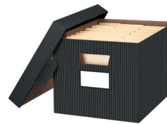
BOÎTE D'ARCHIVAGE RAYÉE Format lettre/légal 0029803