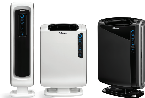
PURIFICATEURS D'AIR AERAMAX MD

Il est important de garder votre bureau à domicile propre, surtout en cas d'épidémie de grippe. Utilisez un purificateur d'air HEPA pour purifier l'air de façon constante et efficace des virus, germes, bactéries et autres polluants atmosphériques.