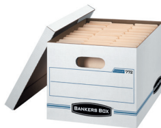
STOR/FILE TM BOÎTE DE RANGEMENT USAGE OCCASIONNEL Format lettre/légal 00772