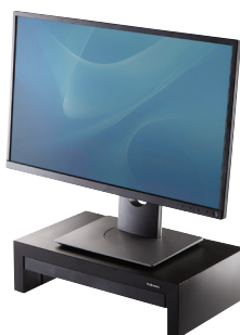
DESIGNER SUITES MC Support pour écran 8038101 – Noir