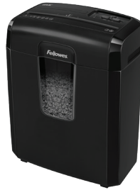
MICROSHERD 8MC Déchiqueteuse à micro-coupe 4692402