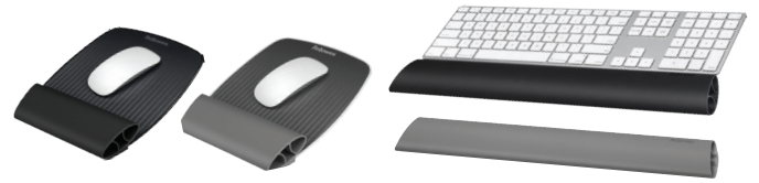
I-SPIRE SERIES TM Repose-poignets Wrist Rocker MC