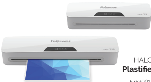
HALO TM Plastifieuses 5753001 - 95 5753101 - 125

Si vous plastifiez pour des événements d'entreprise, des enseignes de bureau ou des documents, ne perdez pas le rythme en travaillant à partir de chez vous. Les plastifieuses pour la maison sont compactes et portables et offrent des résultats de plastification de haute qualité tout en économisant de l'espace.